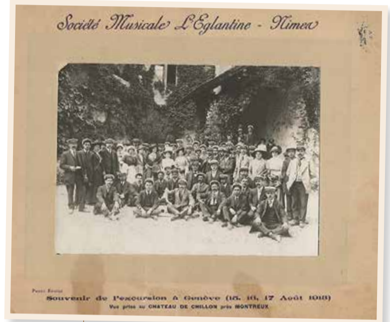
Les membres de la société musicale L'Églantine de Nîmes au Château de Chillon le 16 août 1913.

près - terminent leur visite par une photographie de groupe réalisée par leur concitoyen A. Enguel dit Lange dans la troisième cour du château, alors particulièrement végétalisée. Dimanche, au petit matin, la troupe quitte déjà Genève pour Lyon où elle passe la journée avant de rallier Nîmes pendant la nuit. La brève excursion musicale et touristique touche à son terme, mais une nouvelle escapade est prévue, en Catalogne cette fois-ci. En attendant, l'Églantine donnera «avec son brio coutumier» des bals «qui promettent d'être forts gais», des «dances entraînantes» et des concerts dans son fief. Ces représentations vaudront aux musiciens de Nîmes de faire très bonne figure dans les pages de l'organe hebdomadaire des sociétés musicales et théâtrales L'Echo du théâtre et de la musique ou dans le quotidien Le Populaire du Midi. La photographie réalisée par Enguel trônera dans le salon de l'un ou l'autre musicien, souvenir nostalgique d'un périple dans les eaux lémaniques helvétiques.