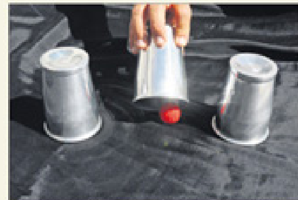
Le truc: «C'est de la manipulation pure. La boule, à un moment, passe sous la main. Il n'y a pas de trucage.»