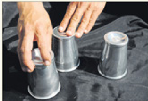
Mélange des gobelets pour brouiller les pistes. La boule n'est jamais là où on l'attendait!