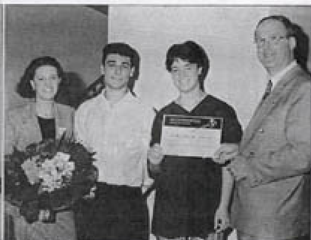
Remise de prix à Martinière.